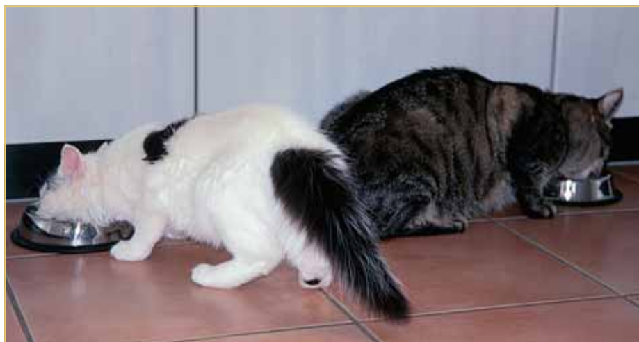
Wird ein Single-Katzen- zu einem Mehrkatzenhaushalt, wird plötzlich die Fütterung zum Thema: Wie Sorge ich dafür, dass jedes BÜSI das richtige Futter und die nötige Menge bekommt? Denn die Katzen werden sich an jedem Napf bedienen (wollen).

Während die beiden BÜSIS noch ihr ahnungsloses Single-Leben führen, bereitet die Zusammenführung den Katzenbesitzern also bereits im Vorfeld einiges Kopfzerbrechen. Schliesslich hängt viel davon ab, ob die beiden Katzen einander akzeptieren: Was tun, wenn es partout nicht klappen sollte? Können wir dann niemals zusammenziehen – jedenfalls nicht, bevor eine der beiden Kätzchen sich ins Reich seiner Urahnen aufgemacht hat? Oder müssen wir nun definitiv eines der beiden Tiere abgeben?