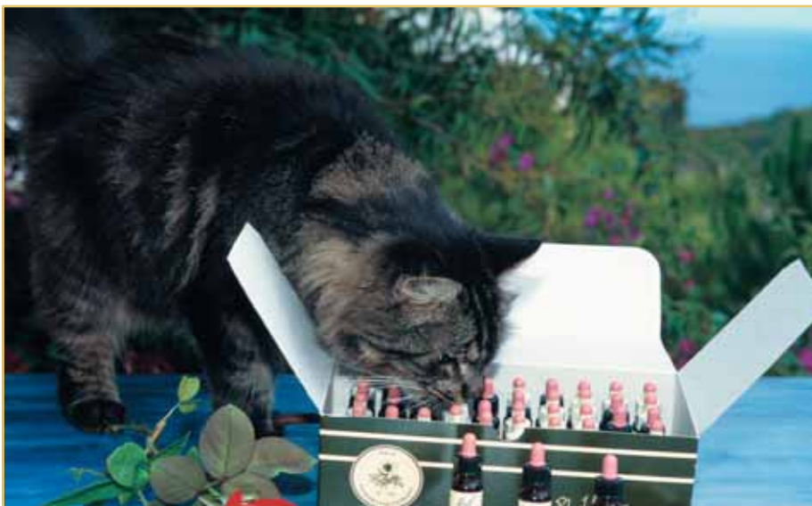
Wie kriege ich zwei Katzen dazu, sich zu mögen? Zahlreiche Hilfsmittel aus Naturheilkunde, Alternativ- oder Schulmedizin versprechen Unterstützung, können allein aber keine Erfolgsgarantie geben.

Doch weg vom schlimmsten aller Fälle – hin zu den ersten, spannenden Tagen der Eingewöhnung: Es empfiehlt sich (meist wird dies schon aus reiner Neugierde der Fall sein), die beiden Katzen tagsüber «unauffällig» zu beobachten und nachts – der segneten Betruhe aller Beteiligten wegen – die «neue» Katze in einem separaten Raum unterzubringen. Hier kann sie sich in aller Ruhe vom Umzugsstress erholen und wenigstens einen Teil der neuen Behausung