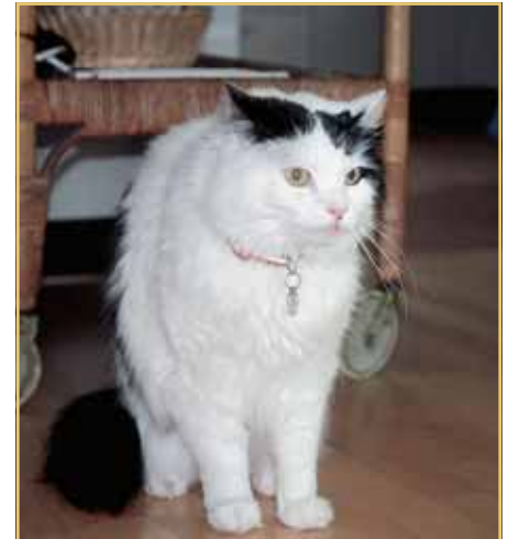
Ein Feind in meinem Haus! Für die Halter/innen gilt: Erst mal abwarten, Ruhe bewahren und bloss nicht eingreifen, solange die eingeschessene Katze mit normalem Abwehrverhalten reagiert.

Wohlan, der grosse Tag ist da: Die beiden Büsis lernen sich kennen. Bewährt hat sich (dies fällt in die Kategorie «Möglichst wenig falsch machen») vor allem eines: Ruhe bewahren. Und dann noch dies: Ruhe bewah-