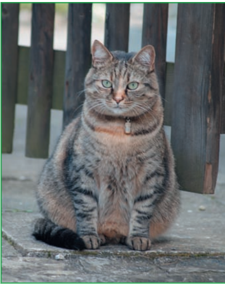
Fastenkuren sind für dicke Katzen tabu, weil sie sonst eine lebensbedrohende Fettleber bekommen können.