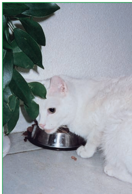
Warum frisst sie denn nicht? Ein Blutbild gibt Aufschluss oder kann zumindest einige mögliche Ursachen ausschliessen.

Ihre Katze frisst immer noch nicht, als Ihnen der Tierarzt am nächsten Tag das Ergebnis der Blutuntersuchung mitteilt: Die Nieren sind gesund, und auch die Leber macht sich gut. Wir haben Glück, der Schilddrüse fehlt nichts, und Folsäure und Vitamin B12 im Blut zeigen, dass der Dünndarm kein Problem mit den Darmbakterien hat. Der Blutzuckerspie-